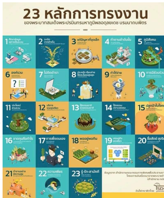
ภาพที่ 15 หลักการทรงงาน 23 ประการ

ของพระบาทสมเด็จพระบรมชนกาธิเบศร มหาภูมิพลอดุลยเดชมหาราช บรมนาถบพิตร