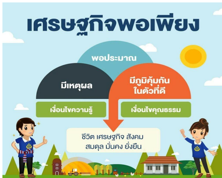
ภาพที่ 14 องค์ประกอบที่สำคัญของเศรษฐกิจพอเพียง (ที่มา : https://sjn.ac.th/เศรษฐกิจพอเพียง-กับพอช )

1. ความพอประมาณ หมายถึง ความพอดี พอจำเป็น และเหมาะสมกับฐานะของตนเอง สังคม สิ่งแวดล้อม รวมทั้งวัฒนธรรมในแต่ละท้องถิ่น ไม่มากเกินไป ไม่น้อยเกินไป และต้องไม่เบียดเบียนตนเองและผู้อื่น เช่น ในภาคส่วนธุรกิจ การลงทุนแบบพอประมาณ พอเหมาะตามความจำเป็นและภายใต้ความเป็นไปได้ ไม่ทุ่มทุนทรัพย์ที่มีทั้งหมด เพื่อไม่ให้ธุรกิจต้องประสบภาวะเสี่ยง การผลิตในจำนวนพอประมาณเพื่อไม่ให้มีสินค้าเหลือ เสียของเสียเงินลงทุน ผลิตตามกำลังศักยภาพขององค์กรเพื่อไม่ให้เกินกำลังจนเกิดความเสี่ยง เป็นต้น